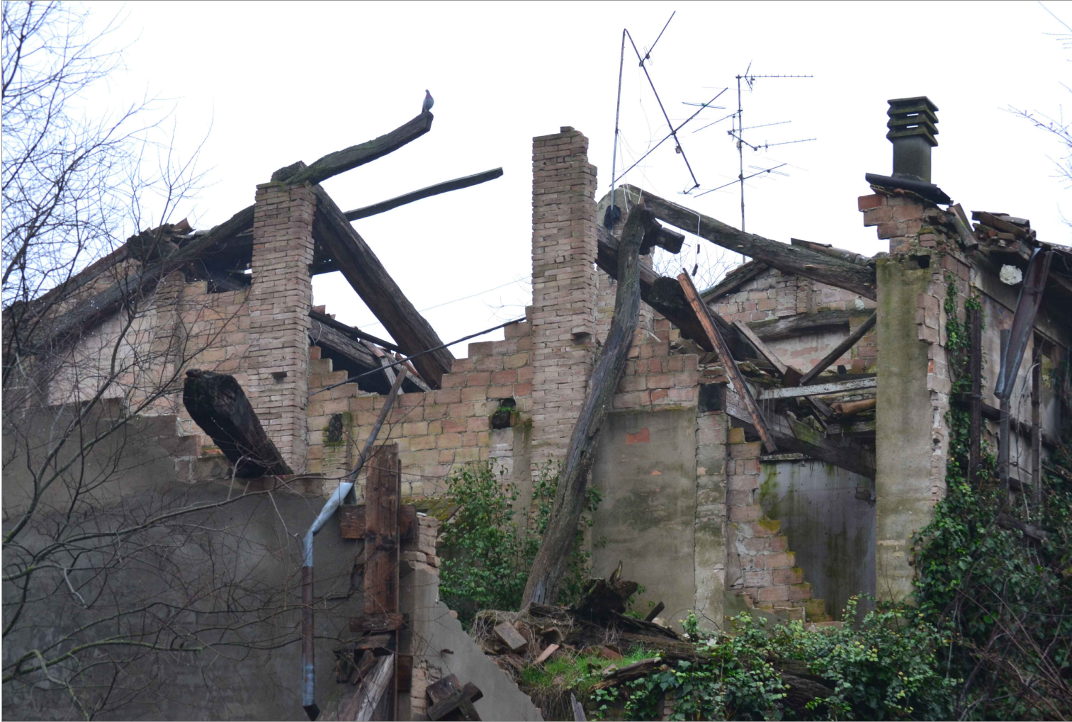
Figura 2. Crollo strutturale dell'ex stalla con fienile allo stato attuale (febbraio 2024)