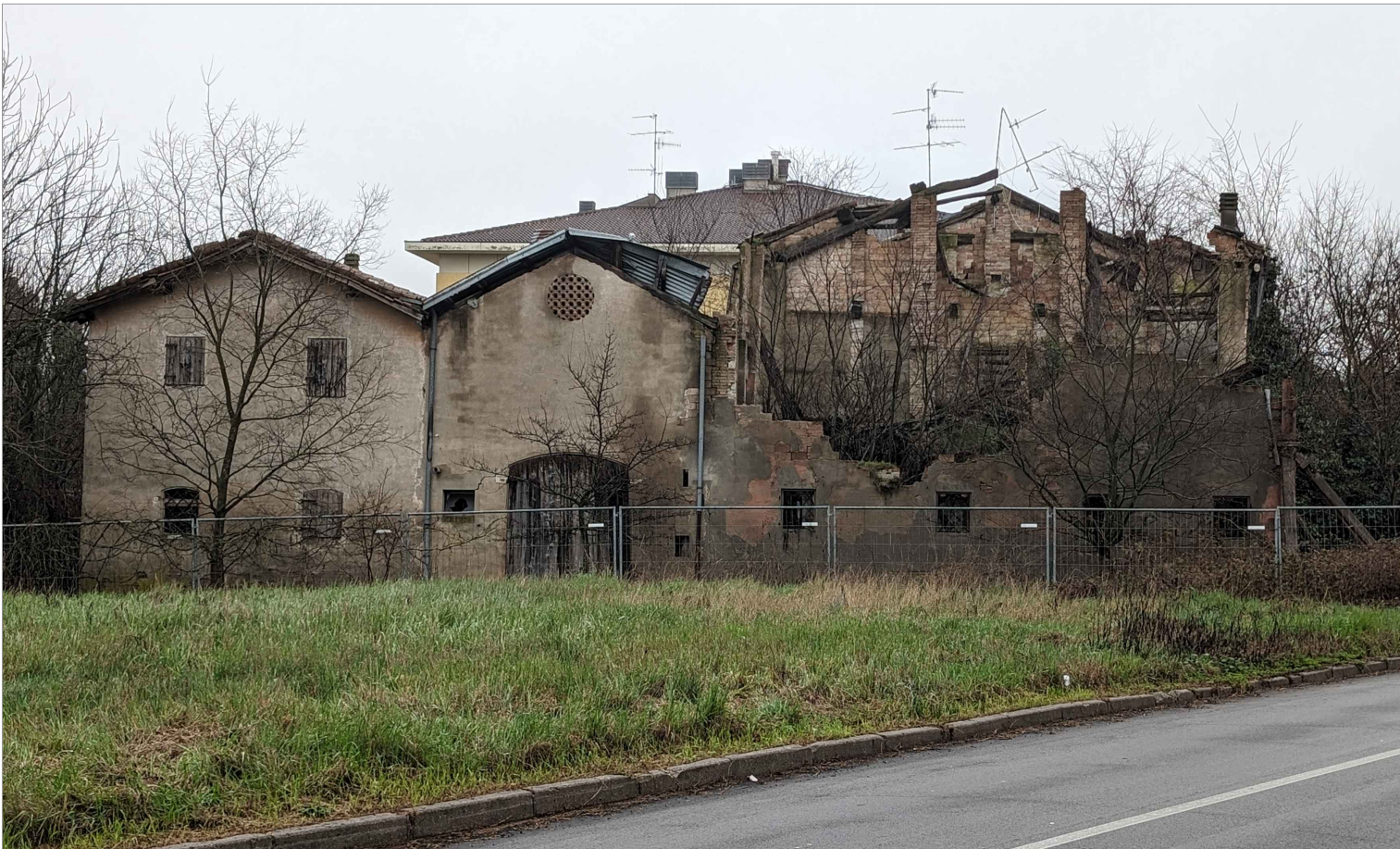
Figura 1. Il fianco Ovest dell'ex parte produttiva dopo i collassi strutturali (febbraio 2024)